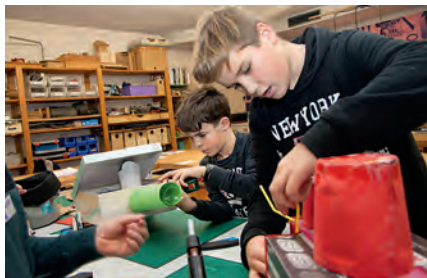
Während die einen dafür sorgen, dass ihr Auto auch wirklich gut aussieht ...