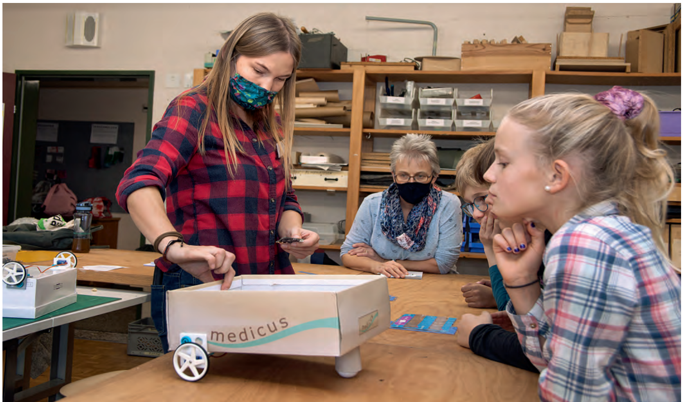
Die Hinterräder bewegen das Auto. Der Pingpong-Ball vorne garantiert, dass das Auto gerade steht und problemlos über den Boden fährt.

Nun steht also jede Dreiergruppe vor der Aufgabe, ein Auto zu bauen, das man per Funk, in diesem Fall mit Bluetooth, fernsteuern kann. Als Fahrzeug dient, wie erwähnt, eine Schuhschachtel. An deren Hinterteil werden zwei Räder mit integrierten Elektromotoren montiert. Jedes der Motörchen funktioniert unabhängig vom anderen. An die vordere Unterseite der Schachtel kleben die Kinder einen Pingpong-Ball. So steht das Auto gerade und fährt problemlos über den Boden, angetrieben von den beiden Hinterrädern. Es ist interessant, zu